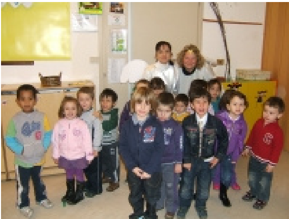
L'angolo degli Angeli...