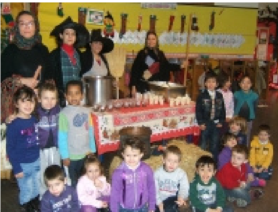
L'angolo delle Befane...