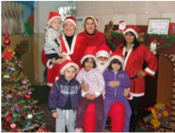
La casa di Babbo Natale...